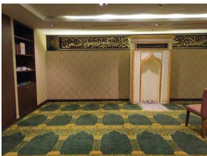
รูปที่ 1 ห้องโถงหามาตในโรงแรม (Al Meroz Hotel)

ทำให้การเงินอิสลามมีความแตกต่างจากการเงินกระแสหลัก (Conventional system) ภายใต้ระบบการเงิน ที่ต้องตั้งอยู่บนพื้นฐานแห่งความยุติธรรมนั้น ส่งผลให้เกิดบริการทางการเงินที่หลากหลาย เพื่อตอบสนองต่อความต้องการของชาวมุสลิม อาทิเช่น ธนาคารอิสลาม (Islamic Banking) การลงทุนอิสลาม (Islamic Investment) การประกันแบบอิสลาม (Islamic Insurance) หรือ ตะกาฟูล ระบบสวัสดิการอิสลาม (Islamic Welfare System) หรือชะกาจธุรกิจฮาลาล (Halal Business) และสหกรณ์อิสลาม (Islamic Co-Operative)