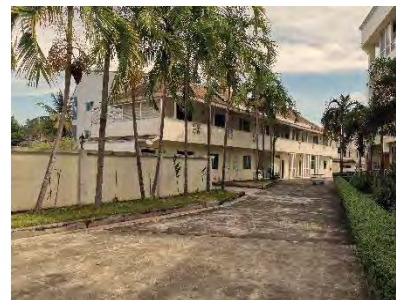
รูปที่ 5 อาคารบริการด้านหลัง (back of house) (Krabi Front Bay Resort)

5.1.6 มีห้องครัวที่บริการอาหาร ฮาลาลและพื้นที่รับประทานอาหารตามแบบอย่าง ท่านนบีมูฮัมหมัด (ช.ล.) ขอความสันติสุขจงมีแด่ ท่าน