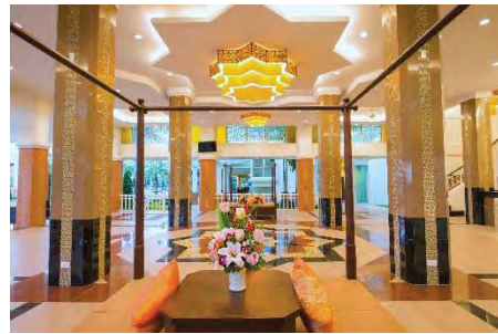
รูปที่ 4 แสดงภาพส่วนโถงต้อนรับ (Krabi Front Bay Resort)

5.1.5 มีการแยกพื้นที่ห้องพัก ระหว่างเพศชายและเพศหญิงที่ไม่ได้สมรส และ พื้นที่สำหรับครอบครัว