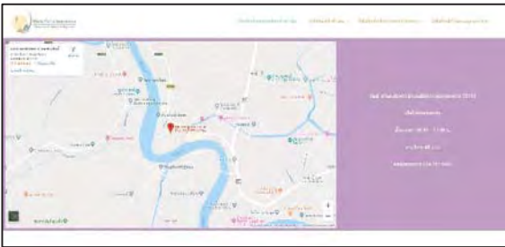
ภาพที่ 17 แสดงหน้าการติดต่อ

หน้าการติดต่อของแต่ละพิพิธภัณฑ์จะเป็นการแบ่งเป็น 2 ส่วนโดยจะมีส่วนของข้อมูลของการติดต่อ และส่วนของแผนที่ Google map