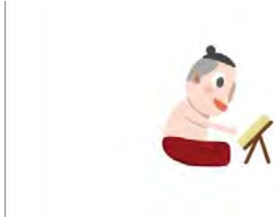
ภาพที่ 20 แสดงรูปตัวการ์ตูนที่วาดครั้งแรก