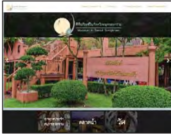
ภาพที่ 12 แสดงหน้าแรกของเว็บไซต์

หน้าแรกของเว็บไซต์จะเป็นสไลด์โชว์รูปป้ายของแต่ละพิพิธภัณฑ์ทำให้เห็นว่าภายในเว็บไซต์มีพิพิธภัณฑ์อะไรบ้างและถัดลงมาจะเป็นเมนูลิงค์ที่จะลิงค์ไปยังเว็บไซต์อื่นตามแต่ละหัวข้อ