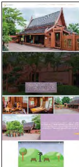
ภาพที่ 13 แสดงหน้าแรกของแต่ละพิพิธภัณฑ์

หน้าแรกของแต่ละพิพิธภัณฑ์ส่วนแรกจะเป็นสไลด์โชว์เลื่อนลงมาจะเป็นประวัติโดยย่อของแต่ละพิพิธภัณฑ์ พร้อมทั้งยังมีปุ่มที่จะพาไปยังอีกหน้าเพจคือ