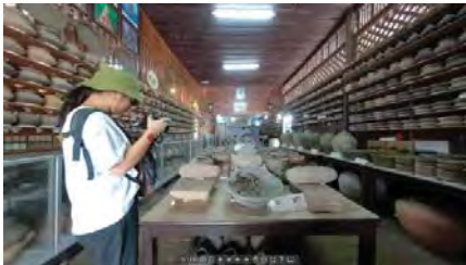
ภาพที่ 8 ทัวร์เสมือนจริงพิพิธภัณฑ์ตั้งเซียมฮะ

3) พิพิธภัณฑ์เครื่องราชครุฑาพระบาทสมเด็จพระจุลจอมเกล้าเจ้าอยู่หัวรัชกาลที่ 5