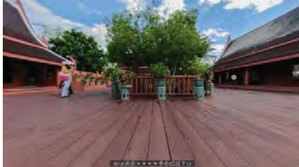
ภาพที่ 7 ทัวร์เสมือนจริงพิพิธภัณฑ์พระพุทธเลิศหล้านภาลัย