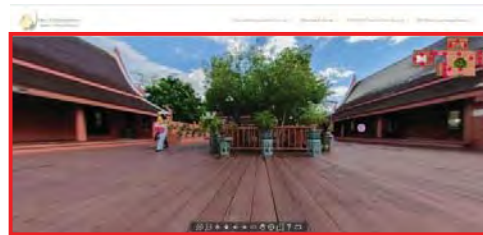
ภาพที่ 19 แสดงการปรับเปลี่ยนให้เต็มจอ

2) ปรับเปลี่ยนมุมมองของกราฟิกของตัวการ์ตูนและใส่แสงและเงาให้กับตัวการ์ตูนปรับเปลี่ยนให้สัดส่วนสมจริงมากขึ้น