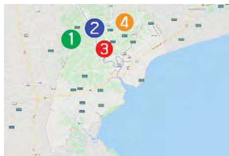
ภาพที่ 1 ตำแหน่งที่อยู่ของแต่ละพิพิธภัณฑ์

ในการศึกษาพิพิธภัณฑ์ในจังหวัดสมุทรสงคราม จะใช้ข้อมูลจากกรมท่องเที่ยวและกีฬาจังหวัด สมุทรสงครามในการสืบค้นจำนวนพิพิธภัณฑ์ที่ยังเปิด ให้บริการอยู่ในปัจจุบัน จากนั้นจะทำการเก็บข้อมูล จากแบบสัมภาษณ์ เพื่อนำไปสร้างสื่อนำเสนอและ จัดทำเว็บไซต์ประชาสัมพันธ์พิพิธภัณฑ์ในจังหวัด สมุทรสงคราม