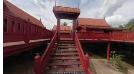
ภาพที่ 10 ทัวร์เสมือนจริงพิพิธภัณฑ์บ้านสวนสมุทรสงคราม

สรุปผลการสัมภาษณ์ความคิดเห็นการตั้งชื่อ Domain name ที่เหมาะสมได้ดังนี้ Domain name ที่ได้คะแนนมากที่สุดคือ www.museuminsamutsongkram.com