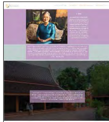
ภาพที่ 14 แสดงหน้าประวัติของแต่ละพิพิธภัณฑ์

หน้าประวัติโดยส่วนแรกจะเป็นประวัติความเป็นมาของแต่ละพิพิธภัณฑ์โดยพิพิธภัณฑ์เริ่มต้นจากใคร โดยจะใส่รูปภาพของเจ้าของพิพิธภัณฑ์ไว้ในส่วนแรก และส่วนต่อมาจะเป็นตัวอักษรเพียงอย่างเดียว โดยจะใส่ภาพไว้เป็นพื้นหลัง