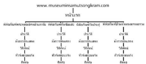
ภาพที่ 11 แสดงโครงสร้างเว็บไซต์

ผลที่ได้จากการสัมภาษณ์และการจัดทำสื่อการนำเสนอ ผู้ทำวิจัยได้วิเคราะห์ข้อมูลและทำการแบ่งหมวดหมู่เนื้อหา อธิบายเป็นโครงสร้างเว็บไซต์ได้ดังนี้