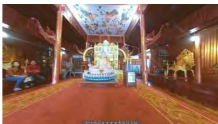
ภาพที่ 9 ทัวร์เสมือนจริงพิพิธภัณฑ์เครื่องราชครุฑาพระบาทสมเด็จพระจุลจอมเกล้าเจ้าอยู่หัวรัชกาลที่ 5

3) พิพิธภัณฑ์เครื่องราชครุฑาพระบาทสมเด็จพระจุลจอมเกล้าเจ้าอยู่หัวรัชกาลที่ 5