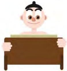
ภาพที่ 21 แสดงรูปตัวการ์ตูนที่แก้ไขแล้ว