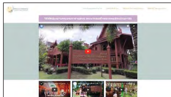
ภาพที่ 15 แสดงหน้าวีดิทัศน์ของแต่ละพิพิธภัณฑ์