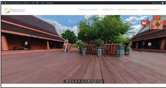
ภาพที่ 16 แสดงหน้าทัวร์เสมือนจริง

หน้าทัวร์เสมือนจริงจะเป็นทัวร์ทั้งหน้าเว็บ เพื่อให้การใช้งานได้ง่ายและชัดเจน