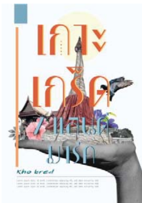
ภาพที่ 2.1 ปกหนังสือเป็นลงสีในคอมพิวเตอร์

ภาพที่ 2 สื่อส่งเสริมการท่องเที่ยว Gide Book เป็นภาพลงสีของแบบร่างสเก็ตช์ที่แสดงให้เห็นถึงเอกลักษณ์ของสถานที่ต่างๆภายในชุมชนเกาะเกร็ดที่มีความน่าสนใจในแต่ละสถานที่ที่ผู้วิจัยได้นำมาอยู่ภายในหนังสือ ออกแบบ