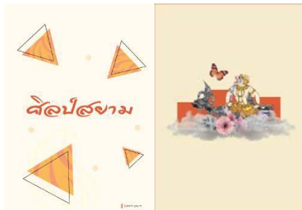
ภาพที่ 2.2 การจัดวาง Layout ด้านในหนังสือ แบบคอมพิวเตอร์