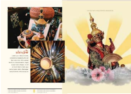
ภาพที่ 2.3 การจัดวาง Layout ด้านในหนังสือ แบบคอมพิวเตอร์