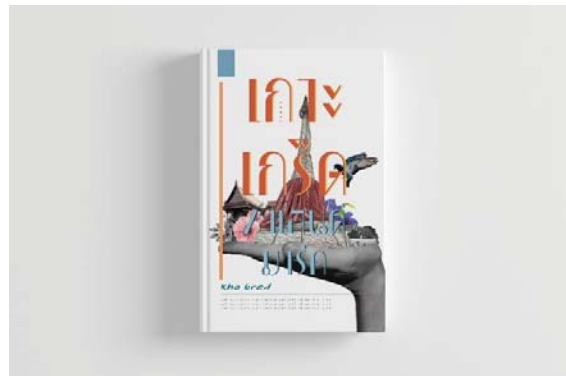
ภาพที่ 3.1 ภาพแสดงตัวอย่างหน้าปกหนังสือ

ภาพที่ 3 ตัวอย่างงานจริงเป็นภาพแสดงตัวอย่างงานในรูปแบบจริง