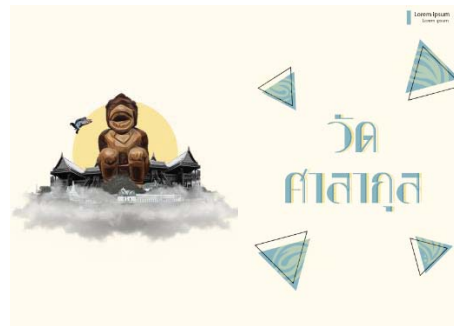
ภาพที่ 2.4 การจัดวาง Layout ด้านในหนังสือ แบบคอมพิวเตอร์

ภาพที่ 3 ตัวอย่างงานจริงเป็นภาพแสดงตัวอย่างงานในรูปแบบจริง