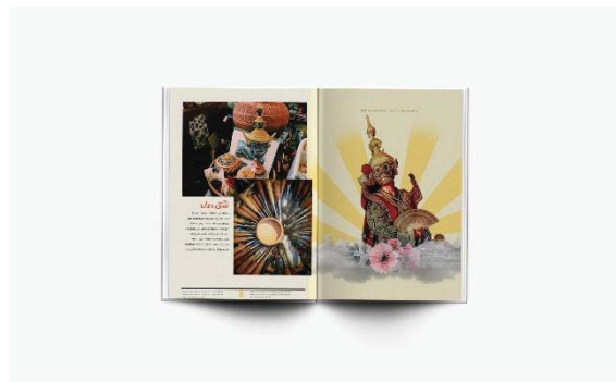
ภาพที่ 3.2 ภาพแสดงตัวอย่างด้านในหนังสือใน รูปแบบจริง