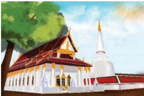
( ภาพที่ 3 คาแรคเตอร์และฉาก )