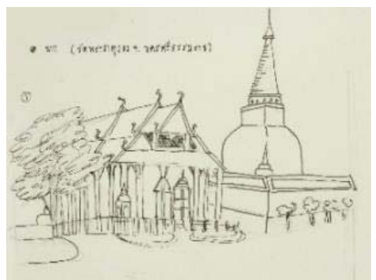
( ภาพที่ 1 แบบร่างคาแรคเตอร์และฉาก )