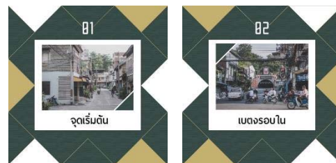
ภาพที่ 3 หน้าหลักหนังสือ

ออกแบบโดยใช้กราฟิกสามเหลี่ยม ที่มาจากโครงการเมืองต้นแบบ “สามเหลี่ยม มั่นคง มั่งคั่ง ยั่งยืน” และนำภาพถ่ายที่เป็นเอกลักษณ์ของอำเภอเบตง มาใช้ให้เหมาะสมกับหน้าหลักของเนื้อหา