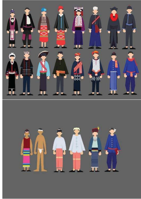
ภาพที่ 2 แบบร่างคอมพิวเตอร์