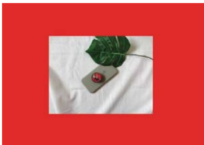
ภาพที่ 7 สื่อตัวอักษรผ่านที่ตั้งโทรศัพท์

ICT media (2556) สืบค้นเมื่อ 13 สิงหาคม 2561, จาก http://www.ictsilpakorn.com