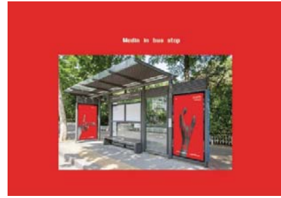
ภาพที่ 3 สื่อตัวอักษรผ่านป้ายรถเมล์

4. การพัฒนารูปแบบตัวอักษรบทสวดมนต์ ผ่านวอลเปเปอร์ผนังห้องพระสำหรับนักศึกษาใน กรุงเทพมหานครฯ ในรูปแบบของการจัดวาง เป็น การจัดวางแบบกึ่งกลาง โดยให้ตัวอักษรวางทับกับ ภาพให้ดูเหมือนการตัดทอนภาพที่หายไปบางส่วน