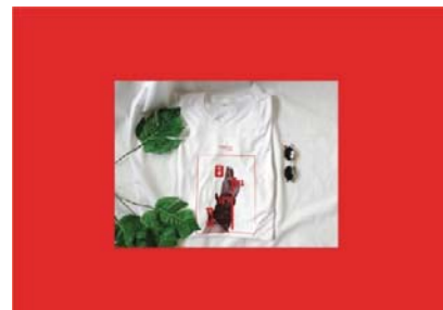
ภาพที่ 5 สื่อตัวอักษรผ่านเสื้อ