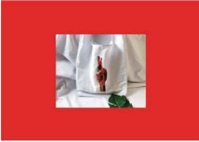
ภาพที่ 6 สื่อตัวอักษรผ่านกระเป๋า

ICT media (2556) สืบค้นเมื่อ 13 สิงหาคม 2561, จาก http://www.ictsilpakorn.com