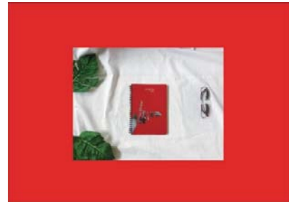
ภาพที่ 4 สื่อตัวอักษรผ่านปกหนังสือ