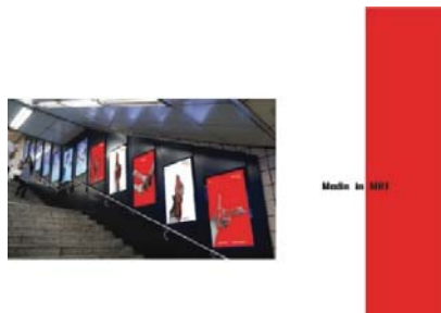
ภาพที่ 2 สื่อตัวอักษรผ่านป้าย MRT