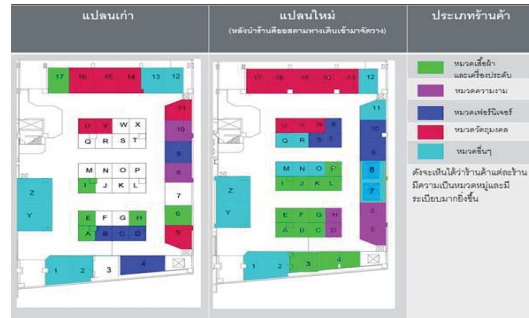
รูปภาพที่ แพลนที่ตั้งเก่าและใหม่